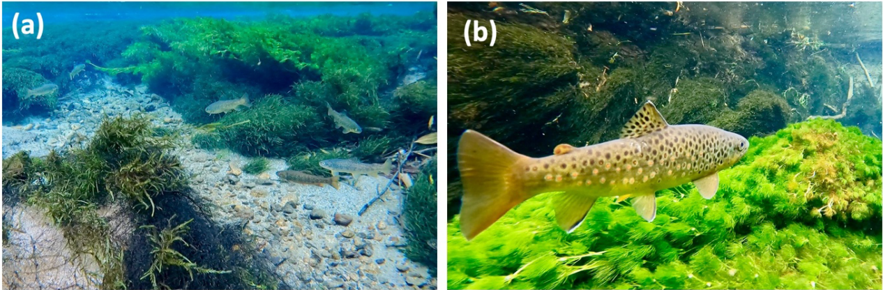
図1 (a) 上高地の支流で生息している外来マス類、(b)全長 40cm 程度の大型ブラウントラウト。