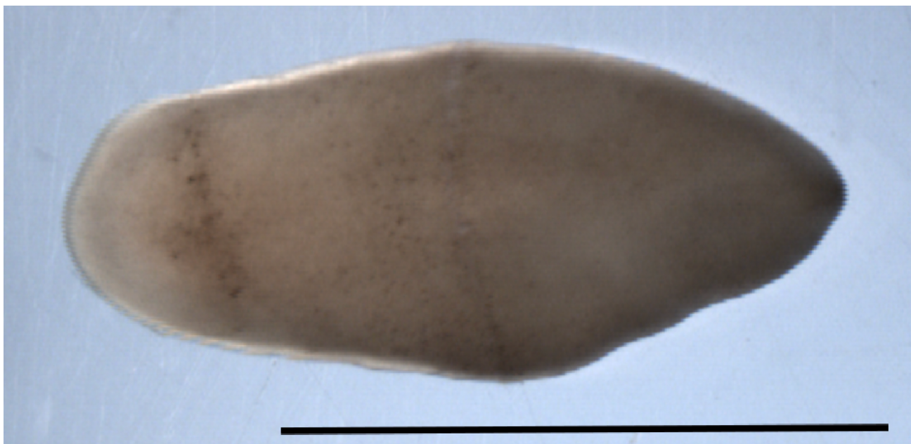
図1 珍渦虫 Xenoturbella bocki 。

写真の左側が前方、右側が後方。人工的に卵や精子を放出させる手法を施していない状態。スケールバー：5 mm