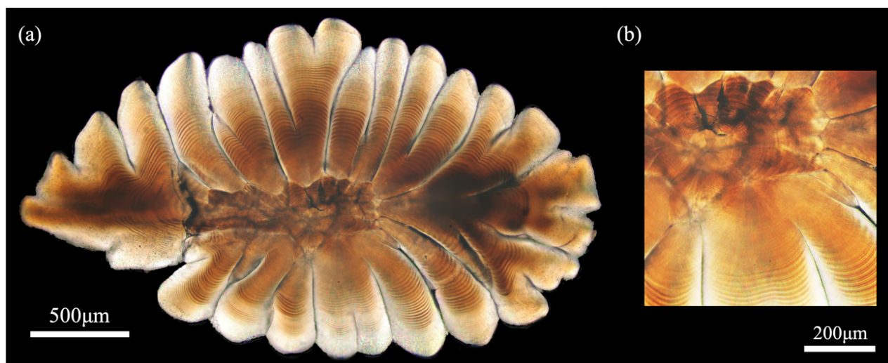
図1. マアジ耳石の顕微鏡写真 (a) と耳石中心部付近に確認できる稚魚期の日周輪 (b)

今回我々は、日周輪の成長幅がマイワシよりも数倍広いマアジの耳石 (図1) を用いることで、1本ごとの日周輪に沿った切削手法を確立し、1日ごとの \delta^{18}\text{O} 履歴 (=経験水温履歴) を解明することを目指しました。