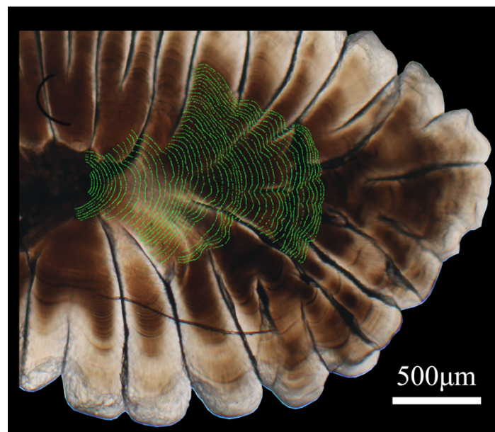
図. マアジ耳石の明瞭化した日周輪

本成果は、2022 年 7 月 29 日に国際学術誌「Rapid Communications in Mass Spectrometry」に掲載されました。