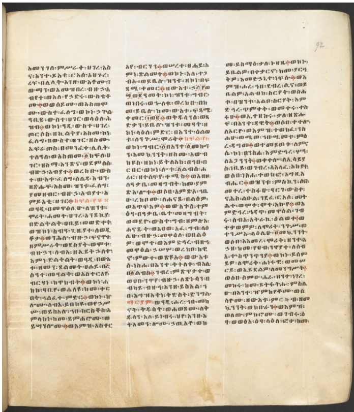
図2 7世紀に編纂されたニキウのヨアンネスによる『年代記』の手書き写本 (British Library, Or 818, fol. 92r) の中で、601年3月10日にアンティオキア (現トルコ) で観測されたと考えられる皆既日食の記述が記載されたページ。この『年代記』は、もともとはコプト語で記述されたと考えられているが、現在では古代エチオピア語 (ゲエズ語) 版しか残っていない。