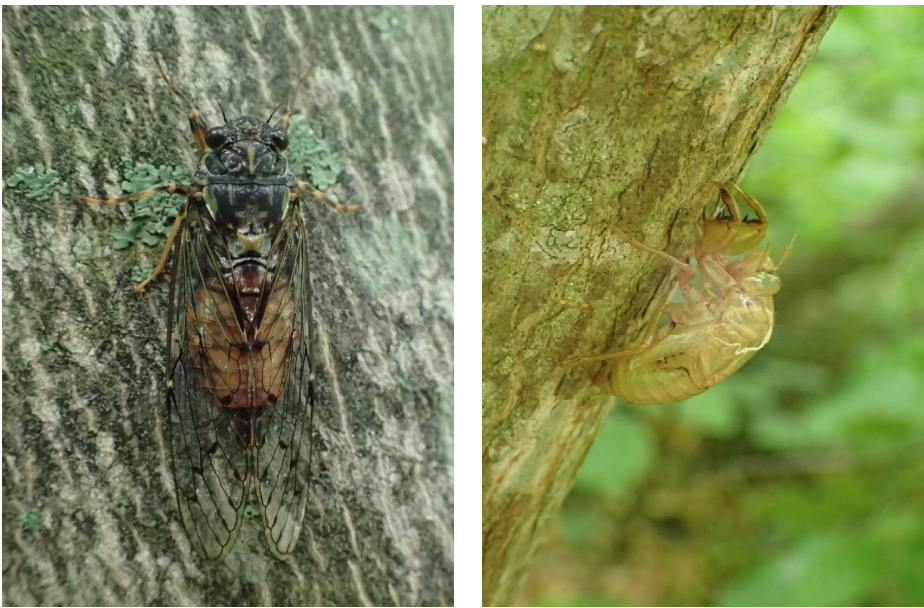
図1 エゾハルゼミ成虫（左）と抜け殻（右）