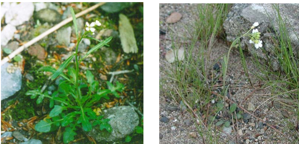
【図1】日本発の倍数体モデル植物ミヤマハタザオ。鳥取県大山の個体(左)と、低地型の垂種タチスズシロソウ(右、滋賀県琵琶湖岸)

そこで本研究では、ゲノムサイズがコムギの35分の1以下の約450Mb (4億5千万塩基対)と小さいミヤマハタザオに着目し、モデル倍数体として開発に利用しました。この植物は、世界中で植物学者による研究が進んでいるモデル生物シロイヌナズナ ( Arabidopsis thaliana ) に近縁であるため、これまでに整備されてきたシロイヌナズナの遺伝子情報や解析技術を応用できるという利点もあります。また環太平洋北部に広がる分布域のうちでも日本で最も遺伝的多様性が高く、標高0 m から3,000 m までと非常に多様な気候に適応した生態学的にも重要な種です。日本発のモデル倍数体種として本グループで研究を進めています。