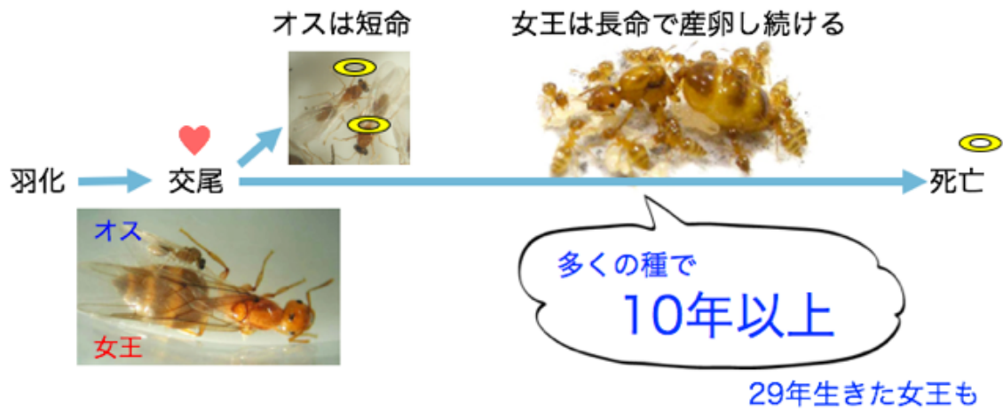
図1 女王アリの生活史。女王アリは羽化後まもない時期にオスと交尾する。オスは交尾後に死亡するが、女王アリは精子を腹部の中にある受精囊に貯蔵し、長い寿命の間、産卵し続ける。