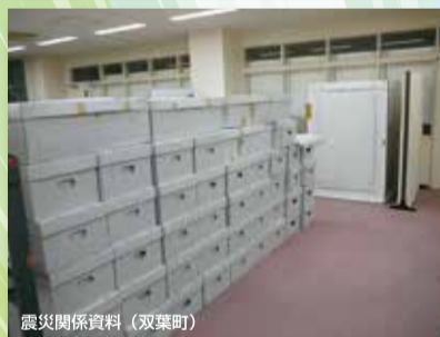
震災関係資料 (双葉町)