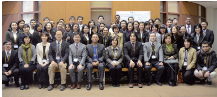
Environmental Diplomatic Leader Education Program Annual Symposium in the University of Tsukuba, on February 15th, 2013

2013 年度には、環境リーダー事業実施 17 大学との連携において、本学が幹事校となり横浜国立大学、東京農工大学との共催により、「環境リーダープログラム合同会議 2013」を開催いたしました。当会議により、2012 年度において事業を終了した 5 大学を含め、