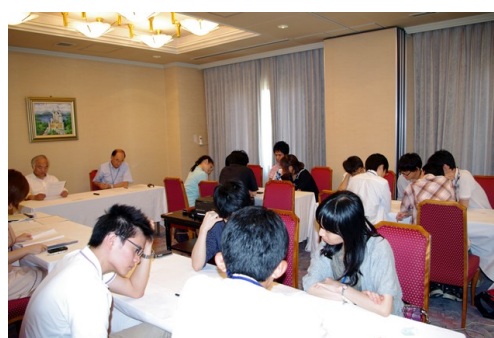
奨学生夏季研修旅行