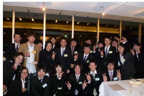
奨学生証授与式・懇親会