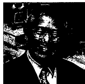
米パデュー大学 根岸 英一特別教授 (帝人グループ名誉フェロー) 帝人久村奨学生第5回生(1957年)

そして自らの「夢」を見つけたら真理を突き詰めるまで、とことんチャレンジしてください。今後の皆さんの大いなる活躍に期待しています。