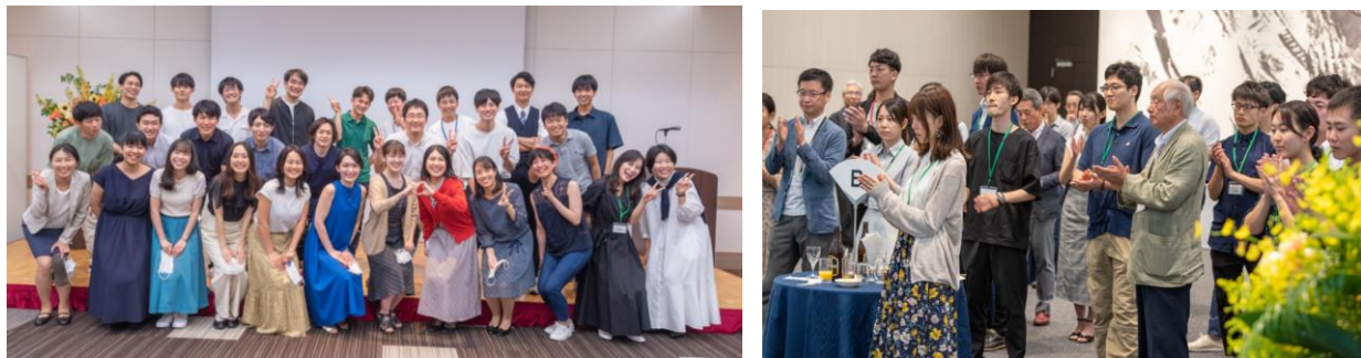
授与式、交流会の様子