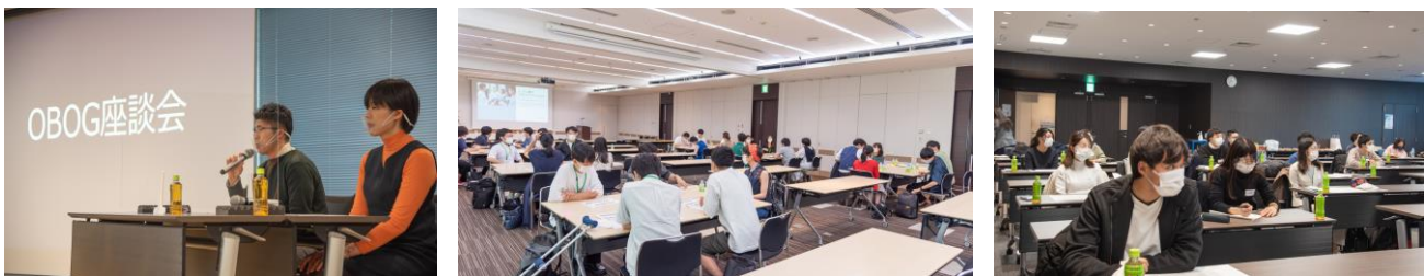
OBOGが来て、初期研修・後期研修の様子などを話したり、奨学生同士の交流もあります