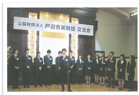
奨学生の近況報告