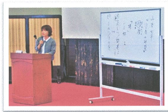
外部講師による講演

又奨学生と育英財団との具体的な事例も予定しています。 社会人と学生との違いなど、将来のことについてもお話しがあります。