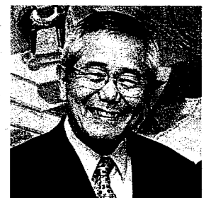
米パデュー大学 根岸 英一特別教授 (帝人グループ名誉フェロー) 帝人久村奨学生第5回生(1957年)

そして自らの「夢」を見つけたら真理を突き詰めるまで、とことんチャレンジしてください。今後の皆さんの大いなる活躍に期待しています。