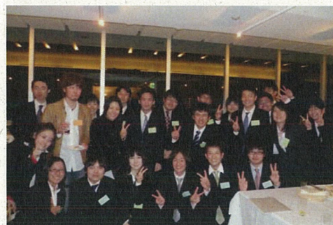
奨学生証授与式・懇親会