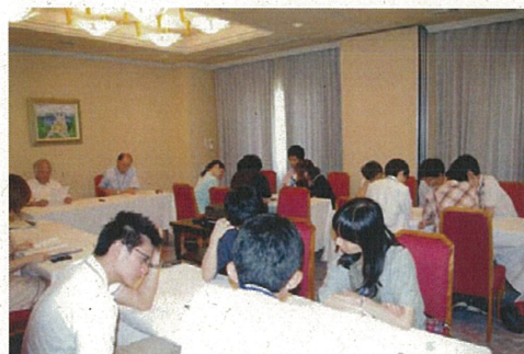
奨学生夏季研修旅行