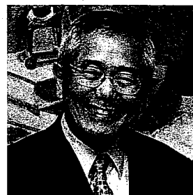
米パデュー大学 根岸 英一特別教授 (帝人グループ名誉フェロー) 帝人久村奨学生第5回生(1957年)

そして自らの「夢」を見つけたら真理を突き詰めるまで、とことんチャレンジしてください。今後の皆さんの大いなる活躍に期待しています。