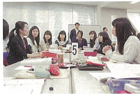
平成27年度第1期奨学生向け「リケジョの未来CAMP」