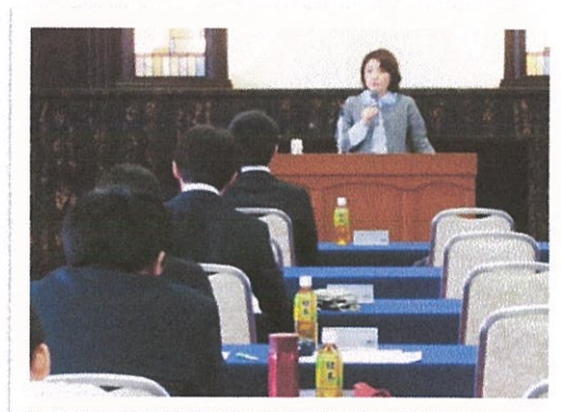
外部講師による講話