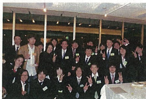
奨学生証授与式・懇親会