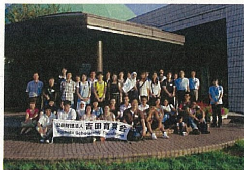
奨学生夏季研修旅行