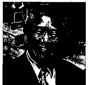
米パデュー大学 根岸 英一特別教授 (帝人グループ名誉フェロー) 帝人久村奨学生第5回生(1957年)

そして自らの「夢」を見つけたら真理を突き詰めるまで、とことんチャレンジしてください。今後の皆さんの大いなる活躍に期待しています。