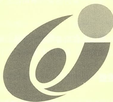
いしかわ教育の日シンボルマーク

(問い合わせ先) 石川県教育委員会事務局 庶務課 学校経営グループ 石川県育英資金担当 〒920-8575 金沢市鞍月1丁目1番地 TEL (076) 225-1816 (直通) FAX (076) 225-1814 E-mail: ikuei@pref.ishikawa.lg.jp