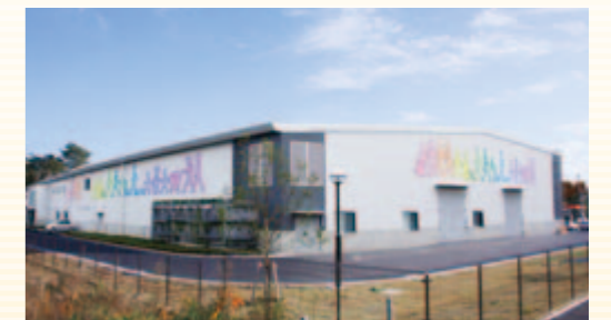
生活支援ロボット安全検証センター

見学ご希望の方は、主催者が指定するグループに分かれ、グループごとにつくば市役所から専用バスでセンターに移動し、案内スタッフの誘導に従って見学後、バスで市役所に戻って解散となります。（※自家用車によるセンターへの移動はご遠慮ください。見学会のみの参加も可能です。）