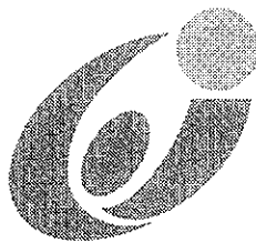
いしかわ教育の日シンボルマーク

(問い合わせ先) 石川県教育委員会事務局 庶務課 学校経営グループ 石川県育英資金担当 〒920-8575 金沢市鞍月1丁目1番地 TEL 076-225-1816 (直通) FAX 076-225-1814 E-mail k-kohou1@pref.ishikawa.lg.jp