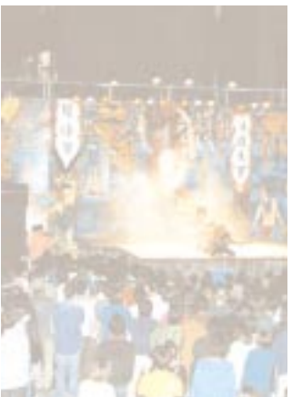
昨年の学園祭のステージ (石の広場で)

今年の学園祭は、昨年末から既に計画段階に入っており、電力や老朽化した設備機材などを放っておくと周辺の人間に危険が及ぶため、学祭以前の問題であり、学祭の目玉の一つとして設置された石の広場周辺の二つのステージについての問題について、膨張を続ける経費と使用電力が、現状のキヤバシティを超えてしまっている。そこで毎年「水上ステージ」と「図書館前ステージ」で企画を行っている団体と学園祭実行委員会との間で話し合いの場を設け、委員会から今年の学園祭では二つのステージを一つに統合する案を提案する形でまとまりました。今後も新ステージについての詳細を固めるための話し合いが継続します。