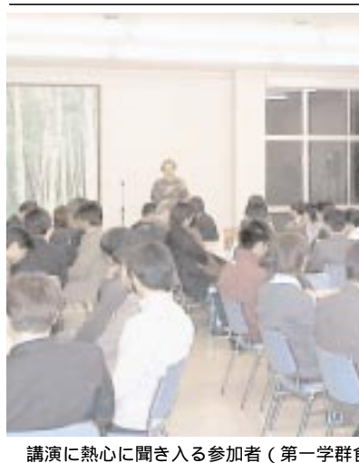
講演に熱心に聞き入る参加者(第一学群食堂)

普段関わりの少ない地域の社会人と学生との懇親を目的とした異業種交流会が二月十五日、第一学群食堂で開かれ、学生や社会人、教職員など約八十人が参加した。本学学生向けポータルサイト「ツクナビ」を運営する学生団体「C4」が主催した。