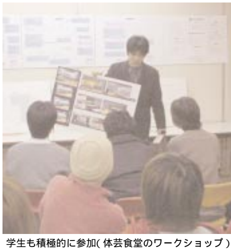
学生も積極的に参加(体芸食堂のワークショップ)