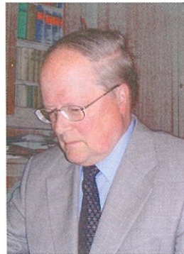
ベルント・バロン・フォン・マイデル