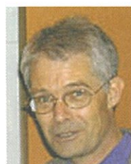
フロリアン・クルマス

1969年東京大学にて理学博士。1984年から筑波大学教授。1998年から2002年まで筑波大学副学長、2004年から現職。1994年仁科記念賞受賞。文部科学省科学技術・学術審議会委員、同政策評価に関する有識者会議委員、同独立行政法人評価委員会委員。