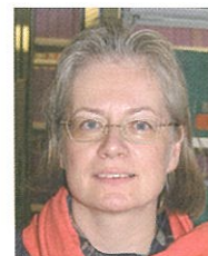
エーファ・マリア・ホーネルライン

社会学・心理学・法律学を学び、1976年デュッセル ドルフ大学にて哲学博士、1980年ハイデルベル ク大学にて大学教授資格取得。1992年から現職。