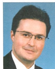
ハラルト・コンラット

1975年ベルリン自由大学修士修了、1977年ビーレフェルト大学にて博士号、デュッセルドルフ大学にて大学教授資格を取得。2004年から現職。